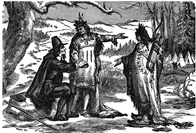
Puritánsky kňaz Roger Williams sa stretáva s Indiánmi

Niektorí osadníci zbohatli natoľko, že mohli zabezpečiť vyššie vzdelanie svojim deťom a tak v kolóniách postupne vznikali stredné školy aj univerzita. 4 Z Európy sa do Nového Anglicka šírili myšlienky