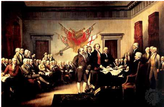
Podpis Deklarácie nezávislosti amerických osád

Americká vojna za nezávislosť a následne vytvorené Spojené štáty stavali na ideáloch osvietenstva, najmä na jeho ústrednom hesle. Výdobytky americkej revolúcie však tieto idey dôsledne nedodržiavali, pretože ideál občianskej rovnosti a slobody sa týkal iba bielych obyvateľov; Indiáni a Afroameričania museli na rovnoprávnosť čakať ešte dlho. Aj napriek týmto faktom sa USA stali prvým nezávislým štátom na kontinente. Až začiatkom 19. storočia sa rozšírila vlna boja za nezávislosť aj do strednej a južnej časti amerického kontinentu, ktorej víťazstvo znamenalo koniec španielskeho kolonializmu.