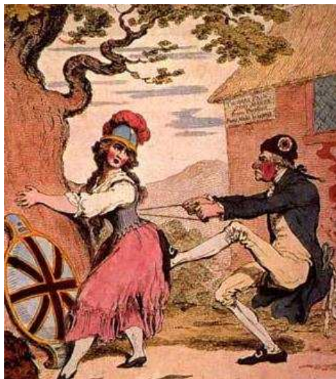
Karikatúra z roku 1793, v ktorej sa T. Paine pokúša obliecť francúzsky korzet Angličanke

Američanom sa podarilo zastaviť britský postup pri Saratoge (1777). Navyše získali Američania pomoc od Španielska a Francúzska. Anglická armáda nakoniec v roku 1781 kapitulovala. O dva roky bola vo Versailles podpísaná zmluva medzi USA a Veľkou Britániou, v ktorej sa Británia zriekla práva na trinásť severoamerických osád, ale ponechala si Kanadu.