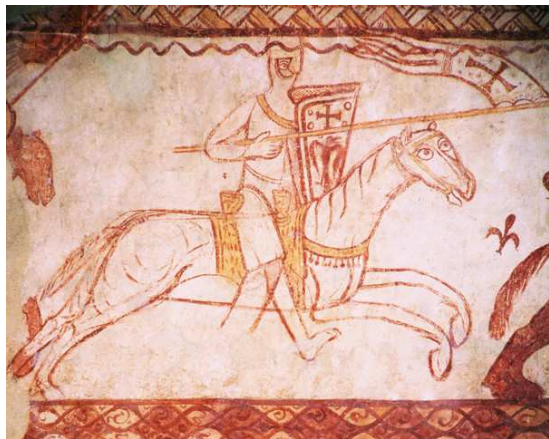
Románska podobizeň rytiera.