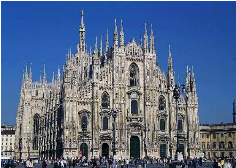
Gotická katedrála v Miláne.

Toto umenie sa označuje najmä ako gotická kultúra , ktorá vzniká v 12. storočí a v Nemecku a strednej Európe existovala až do začiatku 16. storočia. Pomenovanie dostala až od humanistov, ktorí ju vnímali ako umenie a kultúru barbarských Gótov, ako barbarskú neantickú kultúru.