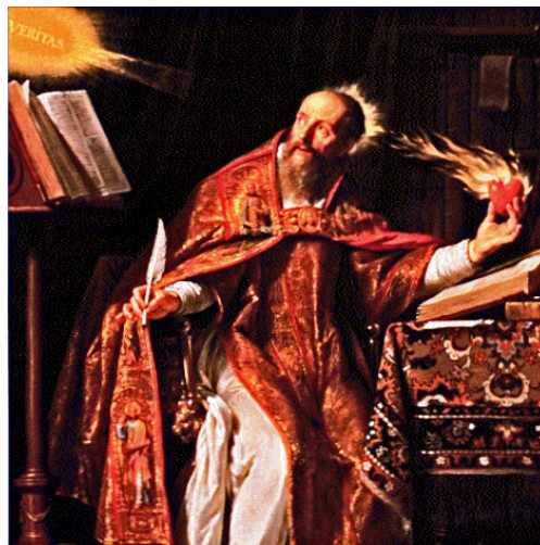
Aurelius Augustinus (sv. Augustín).

Hlavným tvorcom stredovekej kultúry počas celého obdobia bola katolícka cirkev. Do tvorby kultúry sa len sporadicky a postupne zapájalo aj meštianstvo a svetská šľachta.