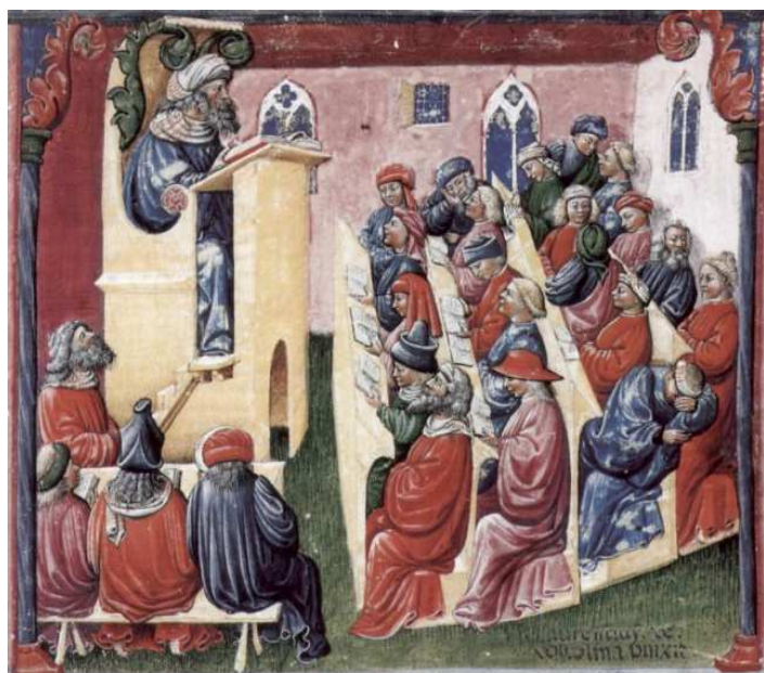
Vyučovanie v stredovekej univerzite.

Stredoveká kultúra vychádzala z Písma svätého , čo len potvrdzuje fakt, že jej tvorcami a šíriteľmi boli kňazi . Títo kňazi vytvorili na základe Biblie aj prvé ucelené myslenie , ktoré dostalo pomenovanie patristika . 1 Myšlienky patristiky sa stali základom učenia a autority katolíckej cirkvi. Najvýznamnejším predstaviteľom patristického myslenia bol Aurelius Augustinus . 2