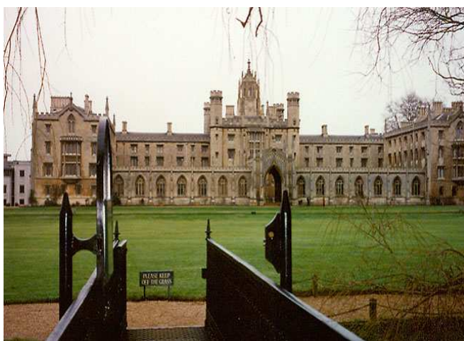
Univerzita v Cambridge.

Prelom 11. a 12. storočia charakterizujú veľké sociálne zmeny , ktoré sa prejavujú najmä v rozvoji obchodu a miest, ktoré tieto zmeny zároveň vyvolávajú. Ďalším dôležitým fenoménom rozvoja stredovekej kultúry je vznik a budovanie centralizovaných monarchií . Cirkev aj naďalej vlastní monopol na tvorbu kultúry a šírenie vzdelanosti . Učiteľmi sú stále kňazi a mnísi, pričom najaktívnejšími cirkevnými rádmi sú dominikáni 7 a františkáni . Dominikánom sa podarilo okrem školstva ovládnuť aj inkvizíciu . 8 Správa štátu alebo mesta si vyžadovala vzdelaných úradníkov , čo zvyšovalo potrebu rozširovania aspoň základného vzdelania. Pod týmto