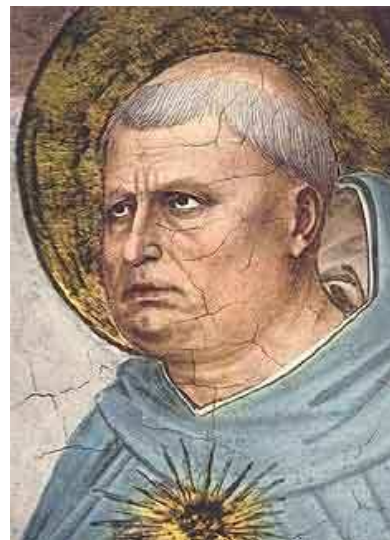
Tomáš Akvinský (sv. Tomáš).

Univerzity odlišovali od ostatných existujúcich typov škôl ich práva a právne postavenie učiteľov a študentov . Zároveň len univerzity mohli svojim študentom udeľovať akademické grady . 11 Rozoznávali sa tri základné stupne: bakalár, magister a doktor, ktoré boli uznávané vo všetkých krajinách Európy a na všetkých univerzitách bez rozdielu. K najvýznamnejším právam univerzít patrila ich správna a právna autonómia. Najznámejšími univerzitami vrcholného stredoveku boli univerzity v Padove, Salerne, Bologni, Paríži, Oxforde a Cambridge. Najbližšou univerzitou k Slovensku, ktorá sa tešila tiež veľkej prestíži bola univerzita v Prahe, ktorú založil v roku 1348 Karol IV..