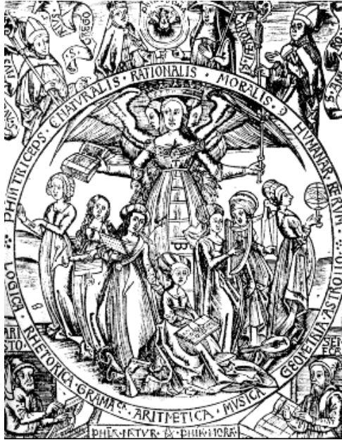
Sedem slobodných umení – alegória.

študenti mohli venovať vrcholu stredovekej vzdelanosti – teológii.