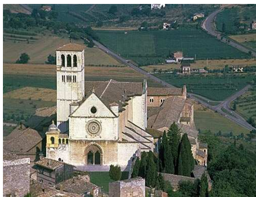
Katedrála sv. Františka v Assisi.

Prvým architektonickým slohom stredoveku je románsky sloh. Najcharakteristickejším znakom sú silné mohutné múry . Svetlo do chrámov prenikalo cez typické malé, polkruhovo zaoblené okná . Súčasťou fasád, ale aj vnútorného priestoru bola bohatá farebná výzdoba . Samotný rozvoj stredovekého umenia začína na konci 8. storočia a je spojený s nástupom karolínskej renesancie vo Franskej