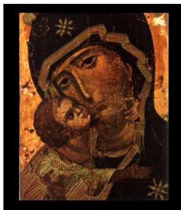
Byzantská ikona Bohorodičky

Začiatkom ..... storočia začali tieto územia ohrozovať ....., ktorí boli ázijskí