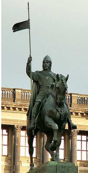
Jazdecká socha sv. Václava

České územie patrilo ....., od ktorej sa odtrhlo po ..... smrti. Česi si tak začali budovať vlastný štát, ktorého najvýznamnejším kniežat'om bol ....., ktorý musel bojovať proti silnému nepriateľovi - ....., ktorému musel platiť dane.