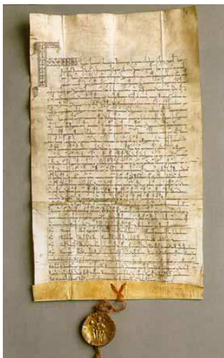
Zlatá bula sicílska