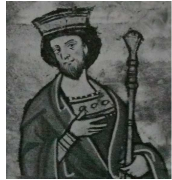
Přemysl Otakar I.