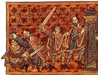
Vražda sv. Václava jeho bratom Boleslavom

Za vlády ..... sa z Čiech stáva silný štát, ktorý rozširuje svoje územia. Tento kráľ sa však chcel stať aj ..... V boji