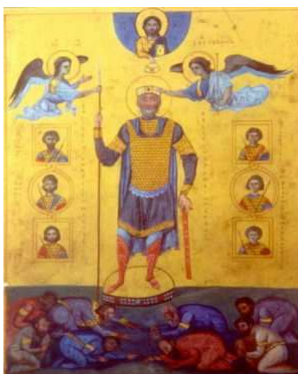
Bazileos II. Bulharobijca

Po jeho víťazstve sa Bulharsko stalo na 2 storočia súčasťou ..... Na konci ..... storočia sa Bulhari oslobodili a vytvorili si tzv. ....., ktorú však po ..... rokoch dobyli ..... Tak sa Bulhari stali súčasťou ..... ríše až do ..... storočia.