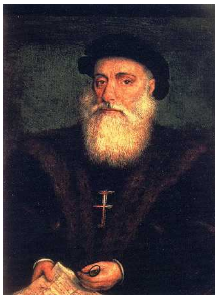
Vasco da Gama

V roku ..... sa doplavil oboplávaním ..... do Indie Portugalec ..... . Španieli sa naďalej pokúšajú nájsť cestu do Indie smerom na západ.