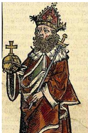
Otto I. Veľký