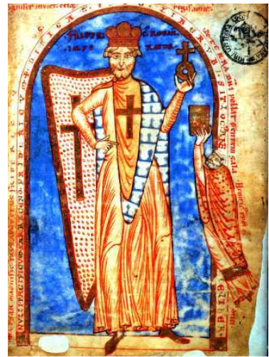
Fridrich I. Barbarosa