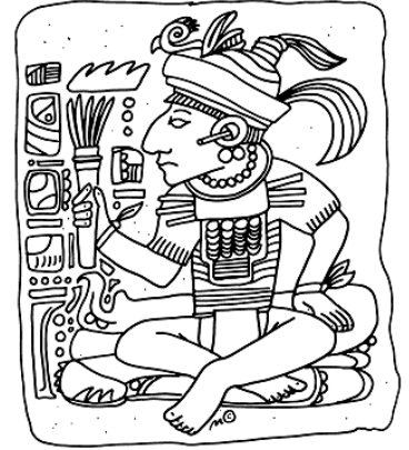
Kresba mayského indiána