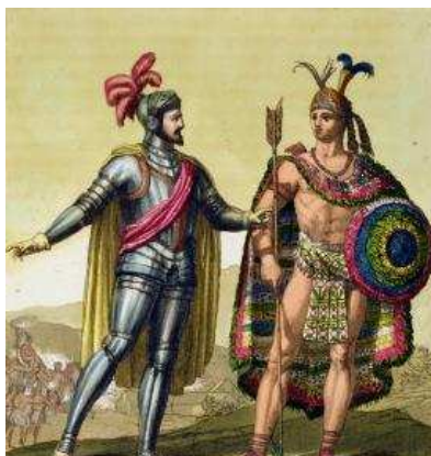
Stretnutie Cortéza a Montezumu

Námornú prepravu v Indickom oceáne ovládli ..... . Na jeho pobreží si vybudovali ..... , ktoré mali chrániť ich lode. V roku ..... dobyli mesto ..... , z ktorého potom kontrolovali obchod s korením.