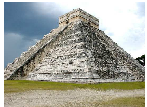
Ku kultúre Aztékov patrili aj pyramídy