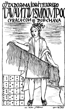
Indián s quipu

Aby sa Atahualpa dostal zo zajatia, ponúkol španielom ako výkupné päťtisíc kilogramov zlata a jedenásttisíc kilogramov striebra. Pizarro nedodrжал slovo a Atahualpa bol popravený a jeho hlavné mesto Cuzco dobyté a vyplienené.