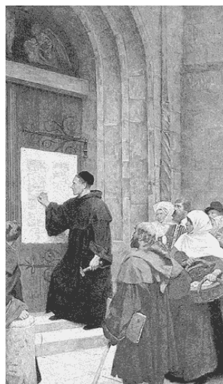
Martin Luther pribíja svoje Tézy vo Wittenbergu

Prvý, kto verejne kritizoval počínanie a neporiadok v cirkvi bol profesor na univerzite vo ..... Svoje námietky proti cirkvi vyjadril v podobe ....., ktoré verejne vystavil ich pribitím na dvere ..... Urobil tak ..... Okrem iného, kritizoval Luther hlavne ..... Tvrdil, že spásu duše za hriechy si nemôžeme zabezpečiť odpustkami ale len ..... a nasledovaním Božieho