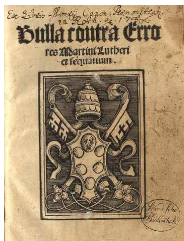
Titulná strana buly, ktorou bol Martin Luther exkomunikovaný

Z Nemecka sa začala reformácia šíriť do celej Európy. Okrem Lutherovej reformácie - ..... vznikli ešte dva ďalšie hlavné prúdy reformácie.