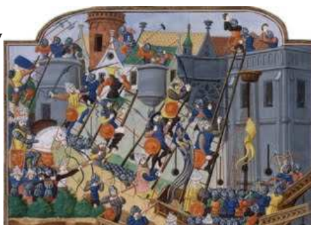
Dobytie Konštantinopolu v roku 1453