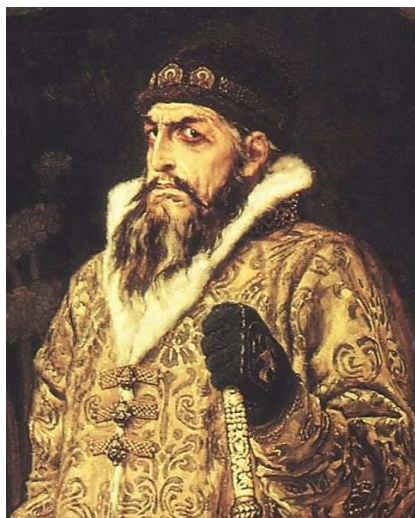
Ivan IV. Hrozný

Ivan sa rozhodol potrestať aj Novgorod, ktorý sa mal údajne pridať k Poliakom. Za tento čin nechal Ivan aj so svojim synom každodenne popraviť od 500 do 1 000 ľudí a dovedna ich bolo popravených nad 60 000.