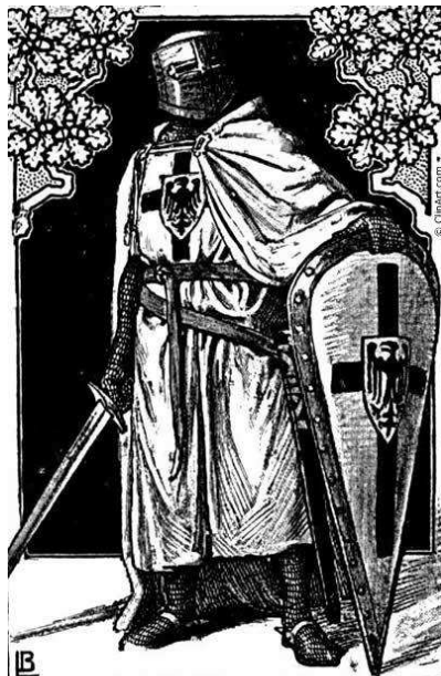
Rytier Nemeckého rádu