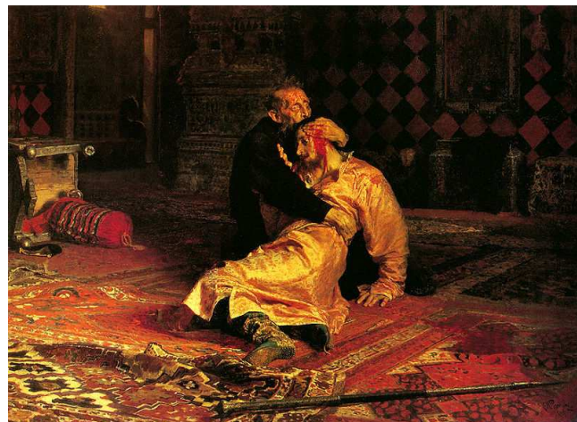
Ivan IV. pri smrteľne ranenom cárovičovi Ivanovi