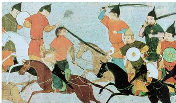
Jazda mongolskej Zlatej hordy

Ivan I. Kalita vyberal pre ..... dane a tí zato dali veľkokniežatstvu pokoj. Mongolov porazil až ..... v bitke na ..... z roku ..... Moci Mongolov sa definitívne zbavil ..... , ktorý začal zjednocovať ruský štát, po tom čo sa v roku ..... vyhlásil za vládcu celého Ruska.