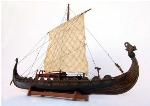
Vikingská loď - drakkar