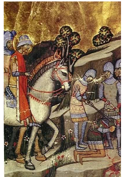
Poprava veľmoža Kopáňa

Nové kráľovstvo bolo rozdelené na ....., na čele ktorých stáli ....., ktorých menoval priamo kráľ. Štefan prijímal do cirkevných a svetských služieb aj ..... Cudzinci tvorili aj jadro armády, ktorým už nebola jazda ale ..... Silná armáda mu pomohla pri obrane kráľovstva proti útokom susedov, najmä ..... a ..... kráľa.