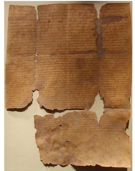
Zoborská listina z roku 113

Nitrianske údelné kniežatstvo nakoniec zaniklo na ..... storočia, kedy sa úplne začlenilo do uhorského kráľovstva.