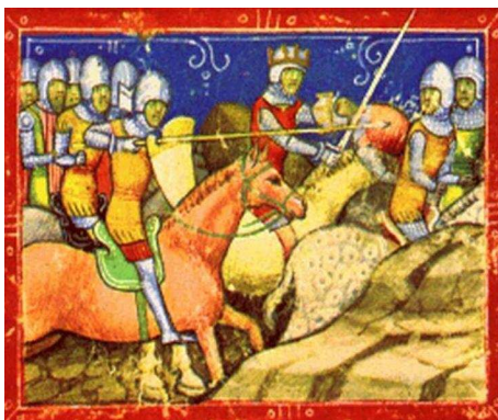
Premysl Otakar II. a Belo IV.

Tak sa Belo rozhodol, že ovládne Rakúsko, ale toto územie chcel aj ....., ktorý bol ..... Títo dvaja panovníci sa stretli v bitke na ..... v roku ....., ktorú prehral ..... a tak sa vzdal akýchkoľvek nárokov na Rakúsko.