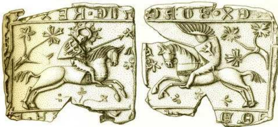
Rudolf I. Habsburský a Přemysl Otakar II.