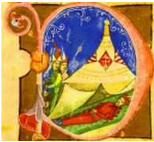
Vražda Ladislava IV. v tábore Kumánov