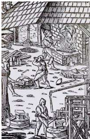
Stredoveké spracovanie železa