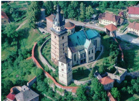
Mestský hrad v Kremnici