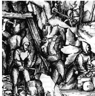
Práca baníkov v stredoveku