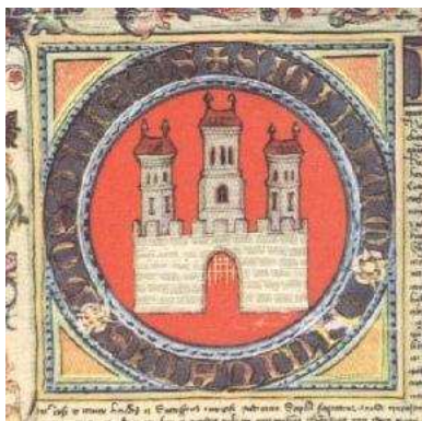
Erb Bratislavy udelený cisárom Žigmundom

Za Žigmundovej vlády sa zavŕšil mestotvorný proces a na Slovensku už nevzniklo nijaké významnejšie mesto. Zato však kráľ posilňuje postavenie ....., ktorí sa môžu zúčastňovať aj politiky štátu, napr. svojou účasťou na rokovaníach ..... Mestám potvrdzoval staré a udeľoval nové privilégia. Napríklad Prešovu a Kežmarku odpustil