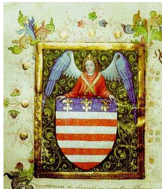
Erb Košíc udelený Ľudovítom I. Veľkým

Aj napriek počiatočným problémom s domácimi i zahraničnými nepriateľmi, znamenala Žigmundova vláda pre Uhorsko ..... a ..... rozmach, ktorému napomáhajú hlavne ....., ktoré kráľ výdatne podporuje.