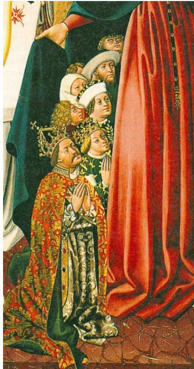
Kráľ Albrecht s kráľovnou Alžbetou

http://www.kosice.sk/clanok.php?file=history_erb_indexsk.htm