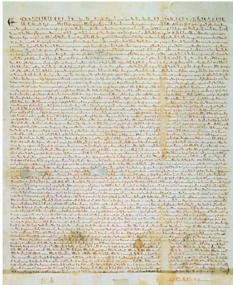
Veľká listina slobôd (Magna Carta Libertatum, 1215)

19. decembra 2007 bola v aukčnej sieni Sotheby v New Yorku predaná jedna zo 17 autentických kópíí Magny carty z roku 1297 americkému obchodníkovi Davidovi Rubensteinovi, ako jedinému súkromnému vlastníkovi na svete. Listina bola predaná za 21, 3 milióna $ (10, 6 mil. £).