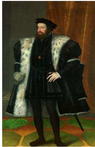
Ferdinand I. Habsburský