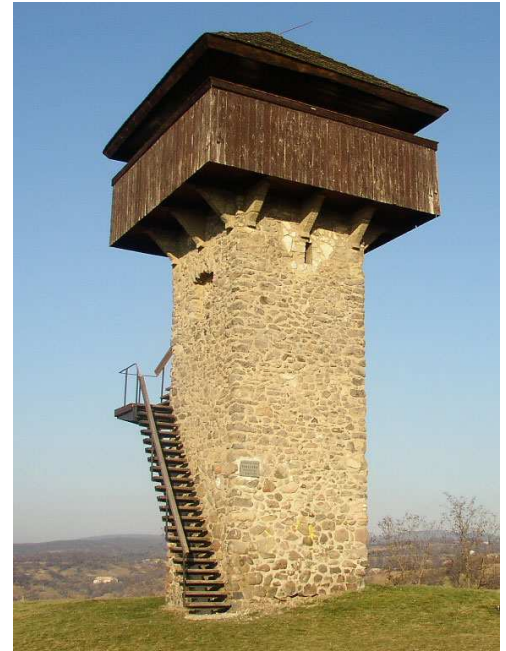
„vartovka“ pri Krupine