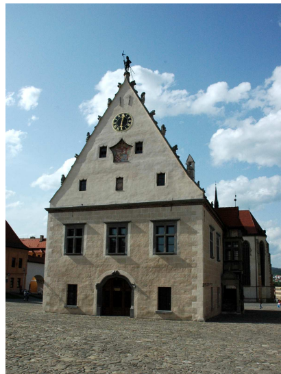
Renesančná radnica v Bardejove