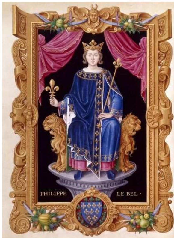
Filip IV. Pekný