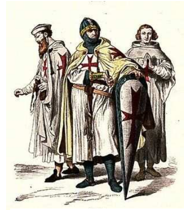
Rytieri templárskeho rádu

Najprv mali prevahu ....., ktorí vyhrali v bitke pri ..... v roku ..... . Obrat nastal, keď sa proti Angličanom postavilo aj francúzske obyvateľstvo, ktoré viedla ..... . Vojnu nakoniec vyhralo ..... a Anglicko stratilo aj svoje posledné územia vo Francúzsku.