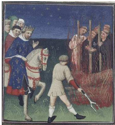
Filip IV. Pekný pri poprave templárov