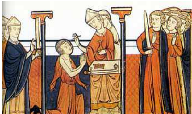
Korunovácia Huga Kapeta