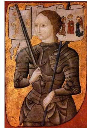
Jana z Arku