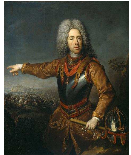
Prince Eugen Savojský

K definitívnej porážke Turecka došlo po jeho prehre pri ....., opäť pod vedením ..... Po tejto prehre boli Osmani prinútení podpísať mier, ktorý bol uzavretý v ..... v roku ..... Tento mier znamenal definitívny koniec vlády Osmanskej ríše nad Uhorskom.