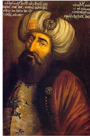
Veľkovezír Kara Mustafa