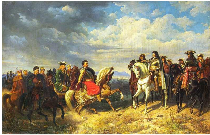
Stretnutie Jána Sobieskeho s Leopoldom I.

..... Za porážku pri Viedni stihla Kara Mustafu poprava. Bol uškrtený hodvábnou šnúrou, čo bol trest pre najzámožnejších Osmanov. Z dobývania mali však aký-taký ošoh aj Viedenčania, ktorí vo vyplienenom tureckom tábore našli vrecia plné zelených bobúľ. Tými bobuľami boli kávové zrná, ktoré poslúžili pri otvorení prvej viedenskej kaviarne neďaleko svätoštefanského domu. S tureckým dobývaním Viedne sa spája ešte jedna legenda. Po bitke začali viedenský pekári piecť pre vyhladovaných Viedenčanov rožky v tvare polmesiaca.