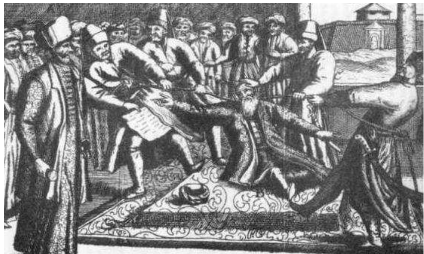
Poprava Kara Mustafu