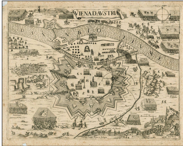
Obliehanie Viedne Turkami v roku 1683

Prímerie porušil ....., ktorý sa v roku ..... rozhodol dobyť ..... Keďže cisár nebol na útok vôbec pripravený,