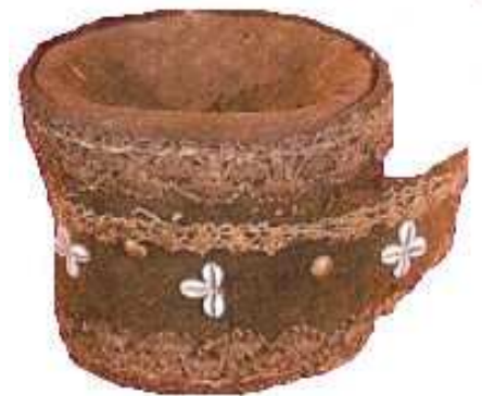
Čiapka Juraja Jánošíka

Jánošík – Pravdivá história , Poľsko, Česko, Slovensko 2009, réžia: Agnieszka Holland, Kasia Adamik