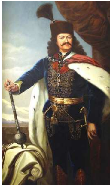
František II. Rákoci