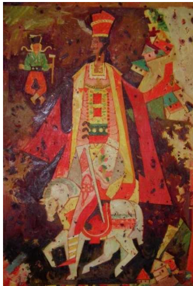
Jánošík na bielom koni (L. Fulla, 1948)