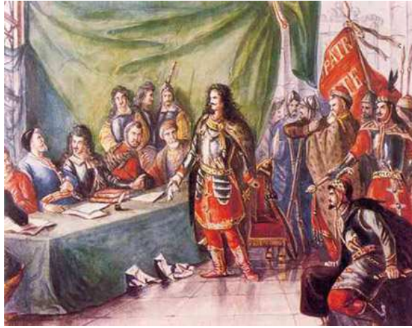
František II. Rákoci odmieta satumarský mier

Doteraz sa nenašiel Jánošíkov hrob. Keďže v rozsudku nebolo napísané, kde má byť odsúdený pochovaný (zbojníkov zvyčajne pochovávali v blízkosti šibenice alebo pod plotom cintorína), pravdepodobne ho dostala na pochovanie rodina. Podľa ústnej tradície pochovali Jánošíka na kuruckom cintoríne v Čemiciach, ale keď sa stavala vodná nádrž Liptovská Mara, bola obec aj cintorín zatopená. Takže, Jánošík možno odpočíva na dne Liptovskej Mary.