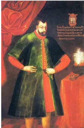
Tradičný šľachtický odev