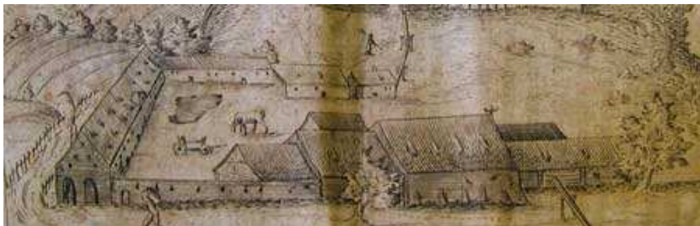
Stredoveká sedliacka usadlosť

Najčastejšou liečebnou metódou bolo podávanie rôznych bylenných odvarov a mastičiek, ktoré boli často vyrábané aj z mletých sušených žiab, hadov a hmyzu. Veľmi dôležitou metódou liečenia bolo púšťanie žilou.