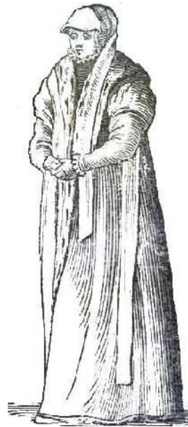
Mešťianka v klasickom oblečení