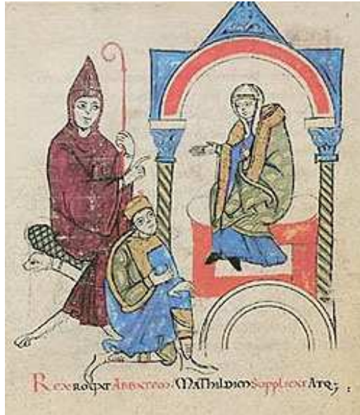
Gregor VII. a Henrich IV. v Canosse

http://www.youtube.com/watch?v=_MbDqc3x97k&feature=related