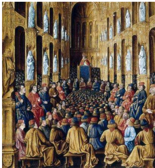
Urban II. vyhlasuje 1. križiacku výpravu

Byzantský cisár požiadal o pomoc v boji proti Turkom pápeža ..... . Ten jeho prosbu prijal a v roku ..... zvolal do francúzskeho mesta ..... cirkevný snem. Na tomto sneme vyzval jeho účastníkov na boj proti moslimom.