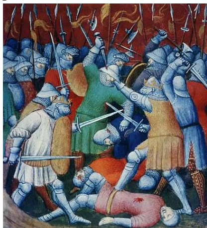
Výprava „korunovaných hláv“

Po celej Európe sa začali schádzať ....., ktorí vytvárali armády. Znakom týchto armád bol ..... . Do bojov sa zapájali okrem rytierov aj obyčajní chudobní ľudia, ktorí často nemali žiadne zbrane. Títo chudobní sa vybrali ku ....., kde sa mali zhromaždiť aj ..... . Táto výprava chudobných sa skončila ich totálnou porážkou.