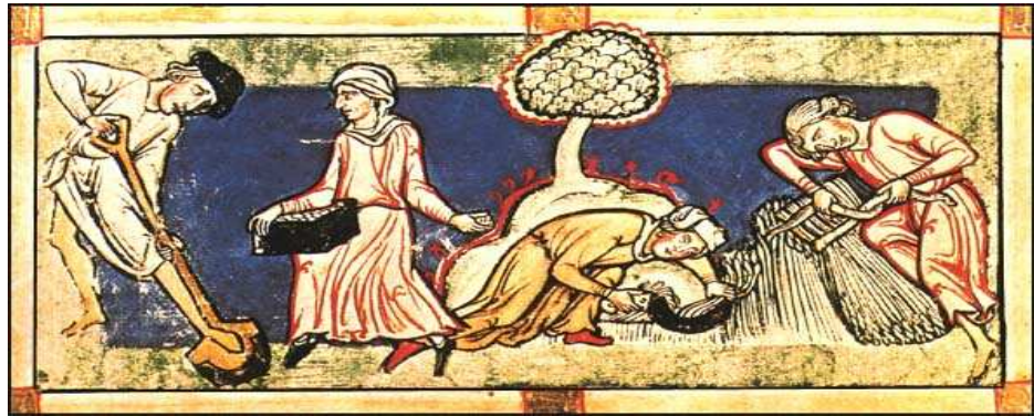
Poľnohospodárska práca v stredoveku II.

Mäso sa jedlo ....., najmä na väčšie sviatky.