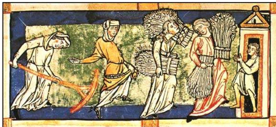
Poľnohospodárska práca v stredoveku I.