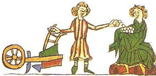
Vazal platí pánovi daň