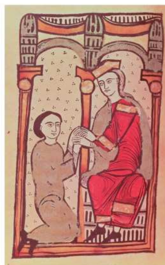
Akt prijatia vazala