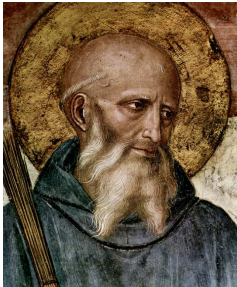
Svätý Benedikt z Nursie (480 – 547)