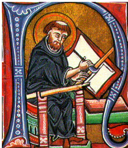
Mních v skriptóriu