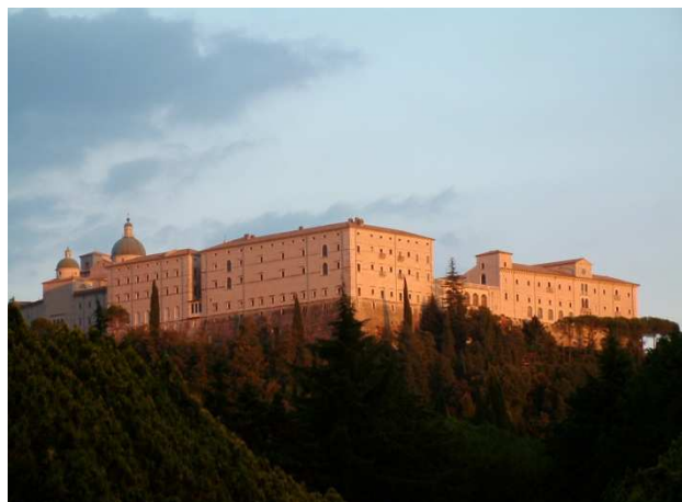
Kláštor na vrchu Monte Casino