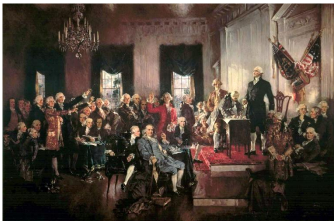
Scéna z podpisu Ústavy USA