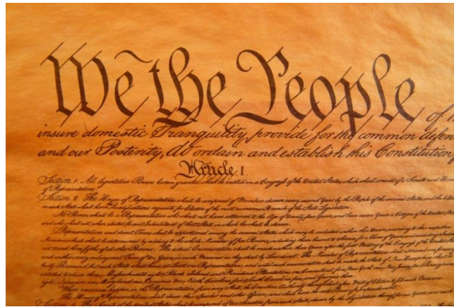
Úvod Ústavy USA z roku 1789

žiadne práva ..... a ....., ktorí pochádzali prevažne z ..... Vznik USA prilákal na kontinent mnoho nových obyvateľov, ktorí postupne vytlačali pôvodné ..... obyvateľstvo z jeho vlastných území.