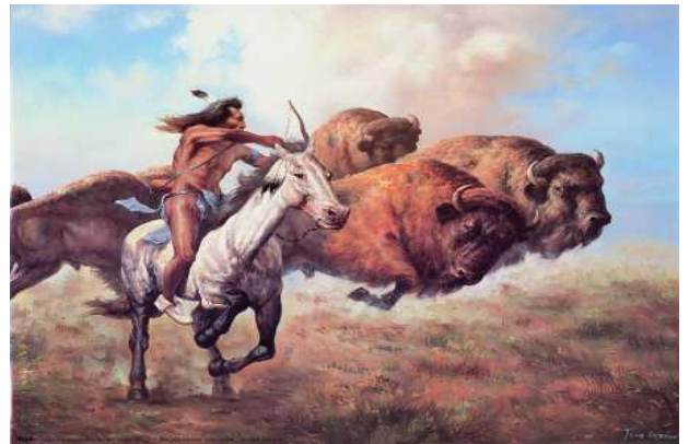
Pôvodný život amerických Indiánov

Domorodci tak nemohli žiť ..... spôsobom života, pre ktorý bol charakteristický ..... a ..... Drastický dopad na Indiánov malo aj množstvo vojen, ktoré museli vybojovať s belochmi, rozšírenie ..... a doposiaľ nepoznané