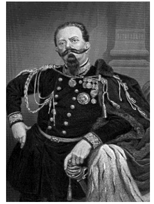
Viktor Emanuel II.