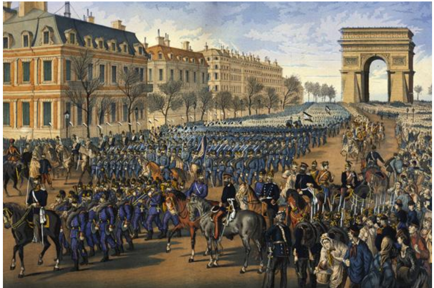
Slávnostná prehliadka pruskej armády v centre Paríža