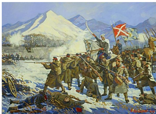
Boj o Šipku