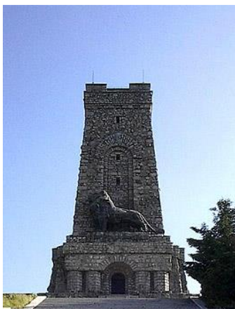
Pamätník na Šipke

Ďalšie veľké povstanie proti Osmanom vypuklo v ..... Povstalci požiadali o pomoc ....., ku ktorému sa pridalo aj ..... Spoločne požadovali pre Grécko uznanie ....., čo sultán razantne odmietol. Na stranu Grékov sa postavilo aj ..... Spojenecká armáda porazila turecko-..... armádu a v roku ..... veľmoci uznali