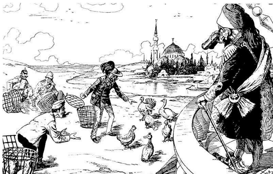
Problémy na Balkáne

Od 14. storočia bol Balkán pod vládou ....., ktorí ho ovládli po bitke na ..... z roku ..... V 19. storočí sa snažia podmanené balkánske štáty získať ..... na Turecku.