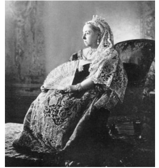
Kráľovná Viktória I.