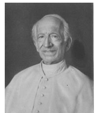
Pápež Lev XIII.

Problém chudobných robotníkov chcela riešiť aj ....., ktorú zastupoval pápež ..... Jeho prívrženci odmietali ..... Úlohou cirkvi bolo pracovať na nových ....., ktoré mali zlepšiť zľú situáciu robotníkov.