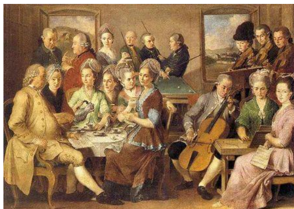
Uhorská šľachta v 18. storočí

..... a ..... Túto migráciu na ..... podporovali aj samotní ....., ktorí si takto zabezpečovali svoje príjmy. Migranti sa usádzali v ..... osadách, ale