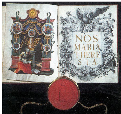
Titulná strana Ratio Educationis