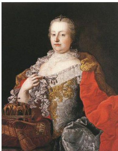
Kráľovná Mária Terézia