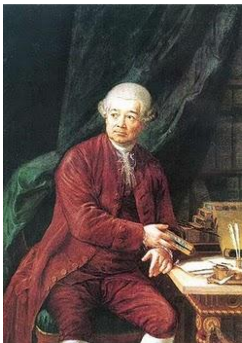
Adam František Kollár (1718-1783)

....., podobne ako M. Bel pochádzal zo Slovenska. Narodil sa päť rokov po poprave ..... a tiež sa narodil v ..... Medzi poddanými nebol až taký známi ako rodák, ale vo vzdelaných kruhoch cisárskeho dvora bol priam „superstar“. Najprv študoval ....., ale pred vysvätením odišiel zo seminára. Vzdelaním bol ..... ale venoval sa aj .....