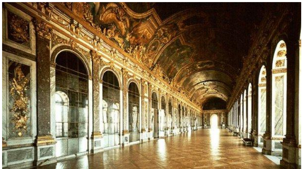
Zrkadlová sála vo Versailles