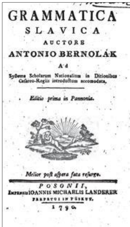
Titulný list Bernolákovkej Gramatiky slovenčiny