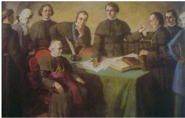
A. Bernolák u biskupa A. Rudnaya pri zakladaní Tovarišstva.