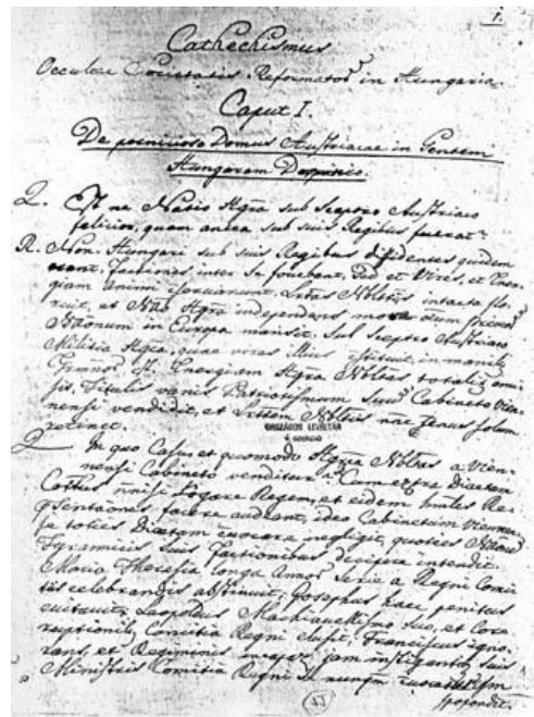
Titulná strana hlavného diela uhorských jakobínov

Táto akcia dokázala, že maďarská vláda ..... v žiadnom prípade zmeniť spôsob svojho vládnutia.