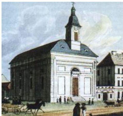
Kollárov kostol v Pešti