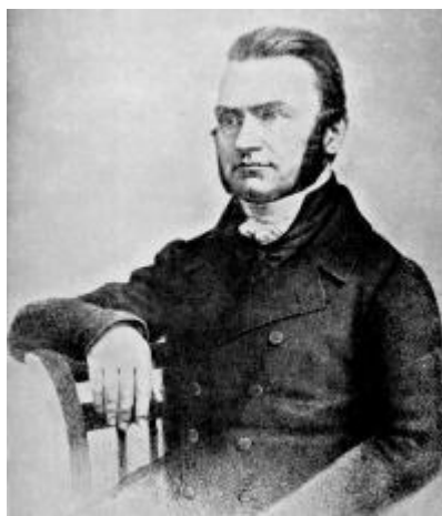
Pavol Jozef Šafárik

Najvýznamnejšou prácou Kollára bola ..... Na základe názorov v tejto práci vypracoval svoju teóriu o ..... všetkých ..... národov. Takto vytvoril svoju ..... , podľa ktorej ..... tvoria jeden ..... , ktorý je rozdelený na ..... kmene: 1 ....., 2 .....,