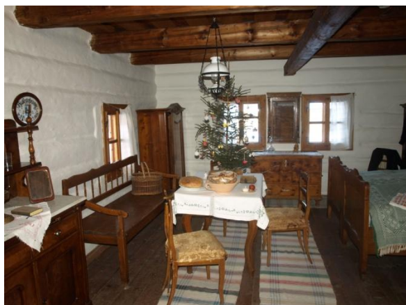
Interiér domu stredného sedliaka

....., ktorá spôsobila niekoľko ..... a následnú veľkú ..... Zároveň upadá aj záujem roľníkov o ..... pôdy. Je to spôsobené aj tým, že roľníci sú ešte stále