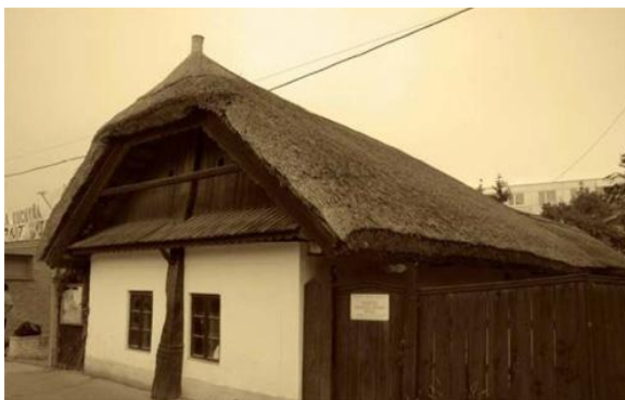
Roľnícky dom z obdobia okolo roku 1730

Uhorské kráľovstvo bolo počas celej svojej existencie hlavne ..... krajinou. Najmä ..... oblasti boli menej ..... a teda aj chudobnejšie.