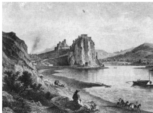
Dobový pohľad na Devín