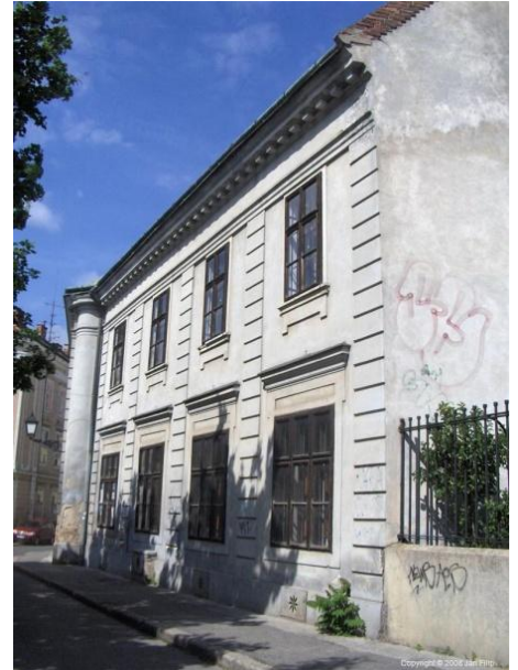
Budova starého evanjelického lýcea v Bratislave