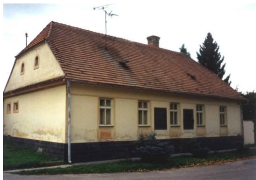
Hurbanova fara v Hlbokom