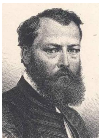
Štefan Marko Daxner