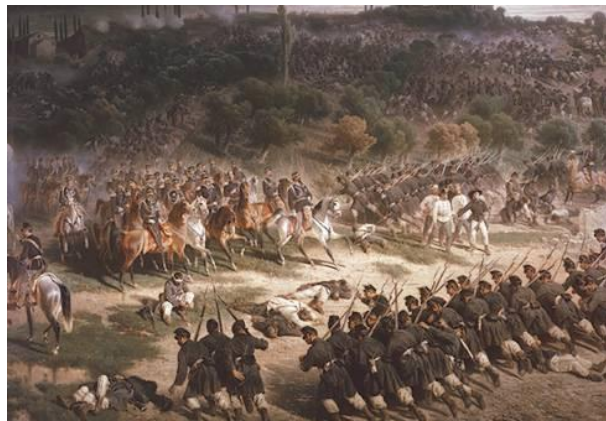
Bitka pri Solferine