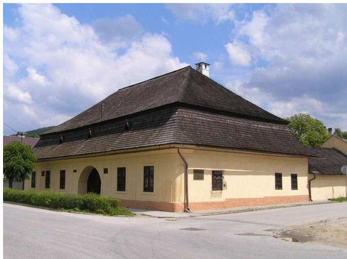
Budova prvého slovenského gymnázia vo Veľkej Revúcej