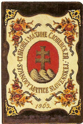
Obal Stanov Matice slovenskej