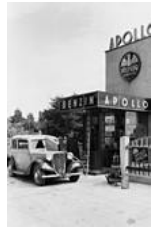
Hlavný vchod do rafinérie Apollo