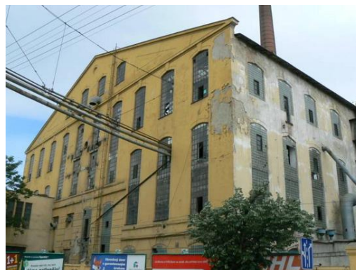
Cukrovar v Trnave

..... Slovenský priemysel sa orientoval na tradičné odvetvia ako boli: ....., ....., ..... a ..... Život Slovákov bol neoddeliteľne spätý s ....., preto pracovalo na našom území aj niekoľko väčších a množstvo menších ..... Najväčší bol vo ..... Na juhozápadnom Slovensku sa rozvíjal ..... priemysel, ktorý bol spojený s výrobou cukríkov a čokolády. V Bratislave