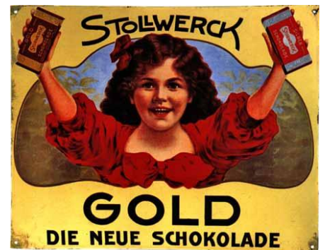
Reklama na výrobky Stollwerck