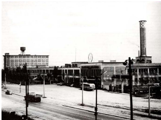
Dynamitka v Bratislave

Priemyselná produkcia sa postupne presúvala z ..... s ..... do ....., kde boli ..... poháňané ..... Následne sa začali otvárať aj nové továrne.