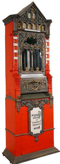
Automat na čokoládu firmy Stollwerck (1889)

V marci 1872 sa slávnostne ukončili práce na Košicko-bohumínskej magistrále dokončením posledného úseku medzi Spišskou Novou Vsou a Kysakom. Železničná trať sa budovala, aby sa spojilo priemyselne rozvinuté Sliezsko so surovinovými základňami na východnom Slovensku. Celá magistrála sa budovala veľmi rýchlo. V januári 1871 sa sprevádzkoval úsek Bohumín – Žilina. V decembri bola trať predĺžená do Popradu a Sp. N. Vsi. Rýchlej výstavbe pomohlo aj 17000 robotníkov, pričom okrem slovenských na stavbe pracovali aj talianski robotníci – špecialisti na horský terén. Celá magistrála (aj s odbočkou do Prešova) merala 368 km. Na trati bolo 9 mostov dlhších ako 50 metrov. Tunely na trase boli dlhé 2200 m a pri výstavbe železnice sa premiestnilo 7, 7 mil. m 3 zeminy a 9, 9 mil. m 3 kameňa. Rozvoj priemyslu znamenal aj rýchlu výstavbu ďalších železničných tratí. V rokoch 1870 – 1878 bolo postavených 1104 km.