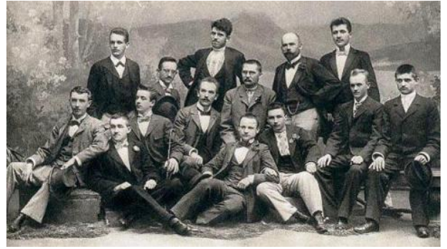
Milan Rastislav Štefánik v kruhu členov spolku Detvan

založená v roku ..... v ..... Hlavnou úlohou tohto spolku bola ..... a ..... slovenským študentom a žiakom v Čechách, pre ktorých sa snažila nájsť miesta v školách v ..... a na ..... Jednota podporovala aj vzdelanosť a kultúru