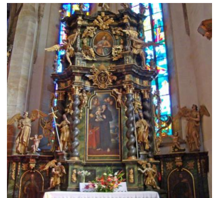
Oltár sv. Antona v Prešove