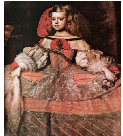
Barokový portrét princeznej