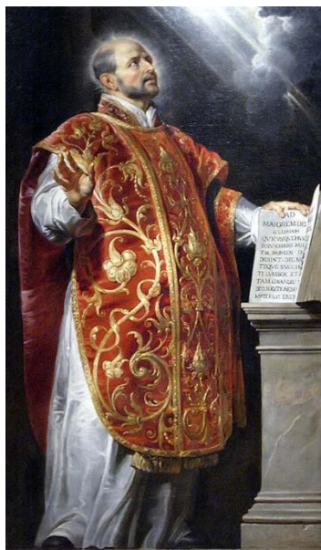
sv. Ignác z Loyoly

Od roku ..... sa v Európe šíri reformácia, ktorá oslabuje moc ..... cirkvi.